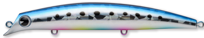
クラッシュイワシ

#X2082 / #X2087 / #X2092 / #X2097 / #X2102