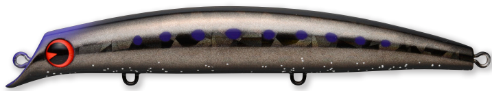
ダボハゼクラッシュ

#X2083 / #X2088 / #X2093 / #X2098 / #X2103