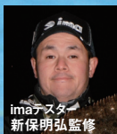
imaテスター 新保明弘監修

今回の平目バカシリーズはシルエットの変化がコンセプト。クラッシュホロはこれまでのimaヒラメシリーズには無い細かな光の変化を醸し出している。ブラックのはっきりとしたシルエットから、アビールのピンク、ナチュラル、シルエットがボケるクリア系、反射のアビールに拘ったメッキカラー。そしてワームとのローテーションで繋ぎとして使えるカラー。マズメ時に勝負を掛けるヒラメ釣りにとって新しいアビールが威力を発揮する。