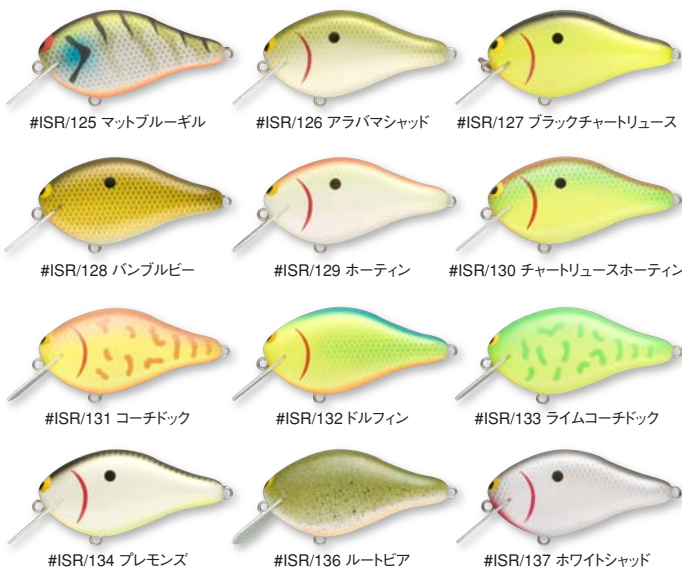
#ISR125 マットブルーギル

Length: 60mm, 2.4 in Weight: 14g, 1/2 oz Type: Lipless Crank Hooks: Owner ST-36 #6, #4