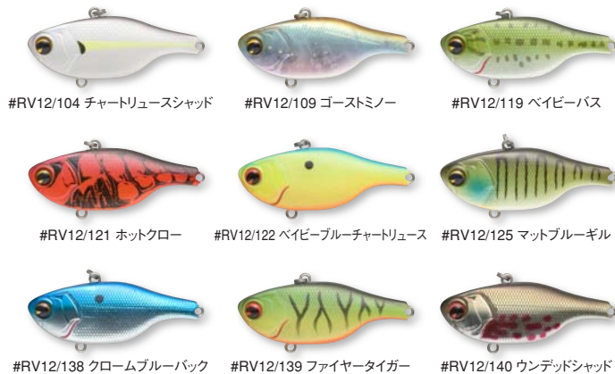
#RV12/104 チャートリュースシャッド