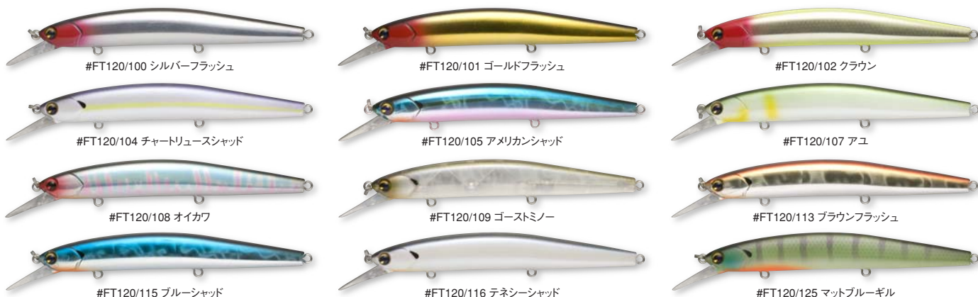
#FT120/100 シルバーフラッシュ

Length: 120mm, 4.5 in Weight: 14g, 1/2 oz Type: Suspends 6-8ft Hooks: Owner ST-36 #6